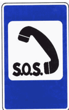
«Телефон экстренной связи»

Указывает место, где находится телефон для вызова оперативных служб.