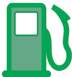
Основы топливной экономичности. Common Rail