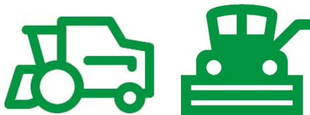
ЗУ и КУ комбайны