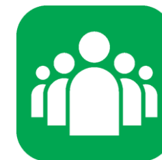
Структура компании. Работа отделов